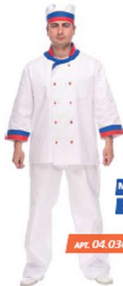
Костюм мужской «Русский повар» (куртка, брюки) ГОСТ 9897-88

Куртка с центральной двубортной застежкой на пугови. Воротник — стойка, с отделкой по горловине. Полочки с нагрудными накладными карманами. Рукава ¾ с отделкой. Брюки на поясе с эластичной тесьмой. Шапка с отделкой. Материал: смесовая ткань 65 % п/э, 35 % х/б, плотность 200 г/м 2 .