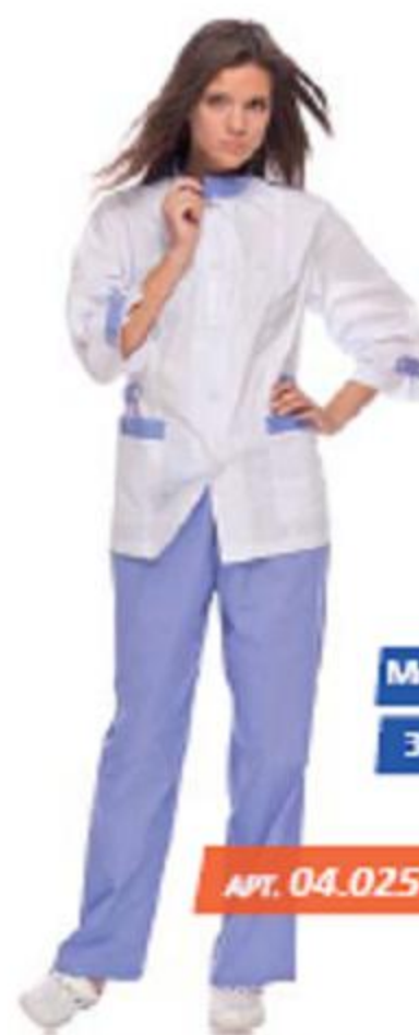
Костюм женский «Незабудка» (куртка, брюки) ГОСТ 9896-88