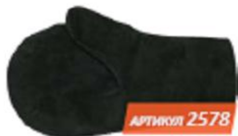
Рукавицы спилковые ТУ 261219-77

Предназначены для защиты рук при контакте с нагретыми поверхностями, от искр и брызг расплавленного металла. Материал: шинельное сукно, спилок КРС.