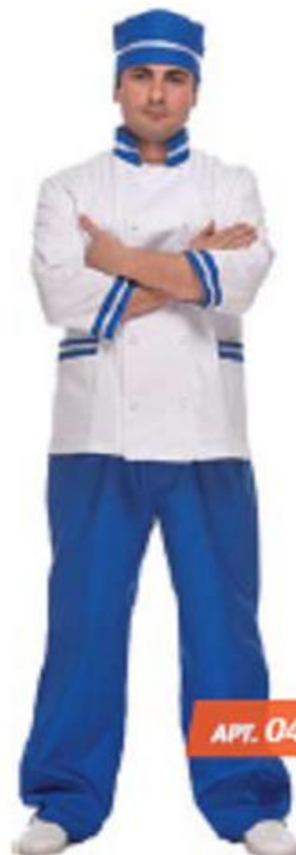
Костюм мужской «Сочи» (куртка, брюки) ГОСТ 9897-88

Куртка с центральной двубортной застежкой на пугови. Воротник — стойка, с отделкой по горловине. Полочки с нагрудными накладными карманами. Рукава ¾ с отделкой. Брюки на поясе с эластичной тесьмой. Шапка с отделкой. Материал: смесовая ткань 65 % п/э, 35 % х/б, плотность 200 г/м 2 .