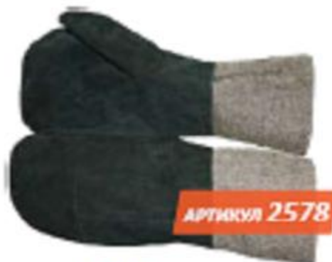
Вачепи ГОСТ 17-735-75

Предназначены для защиты рук при контакте с нагретыми поверхностями, от искр и брызг расплавленного металла. Материал: шинельное сукно, спилок КРС.